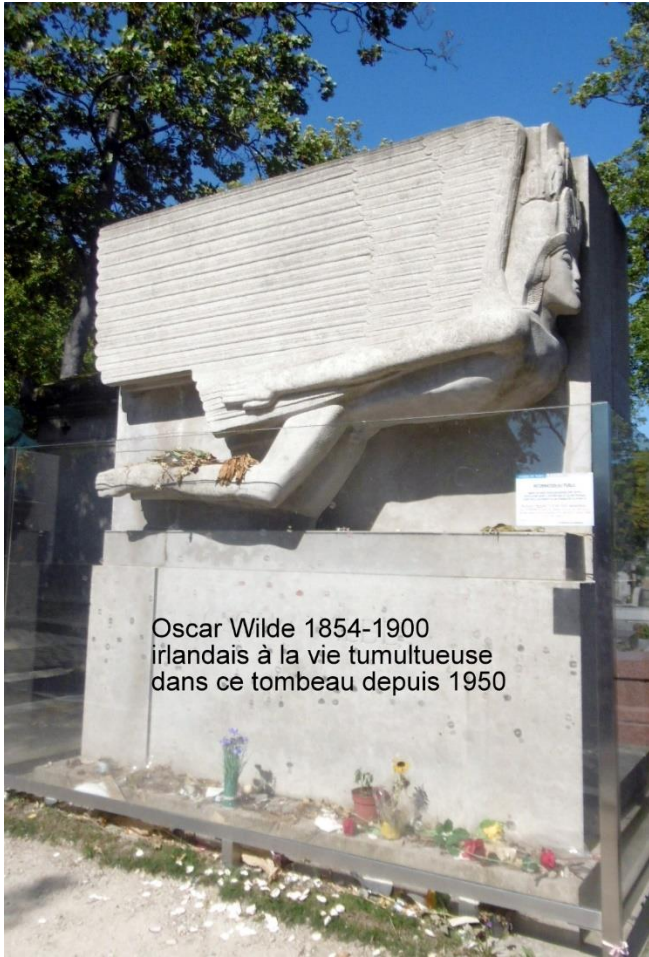
Oscar Wilde 1854-1900 irlandais à la vie tumultueuse dans ce tombeau depuis 1950