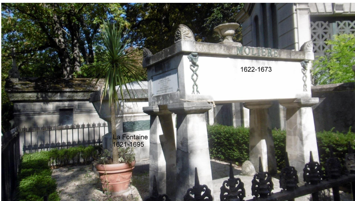
La Fontaine 1621-1695