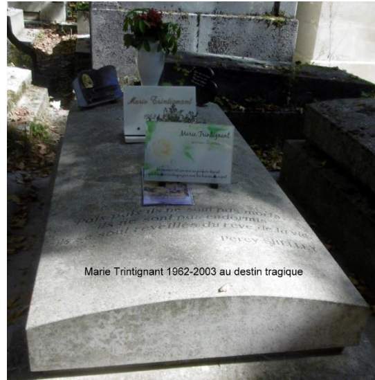
Marie Trintignant 1962-2003 au destin tragique