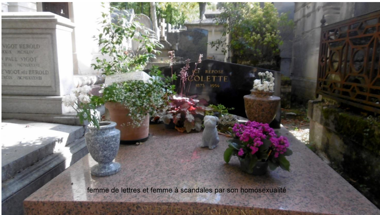
femme de lettres et femme à scandales par son homosexualité