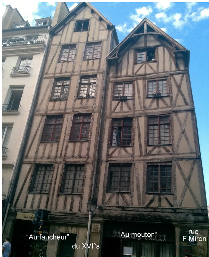
"Au faucheur" du XVI e s