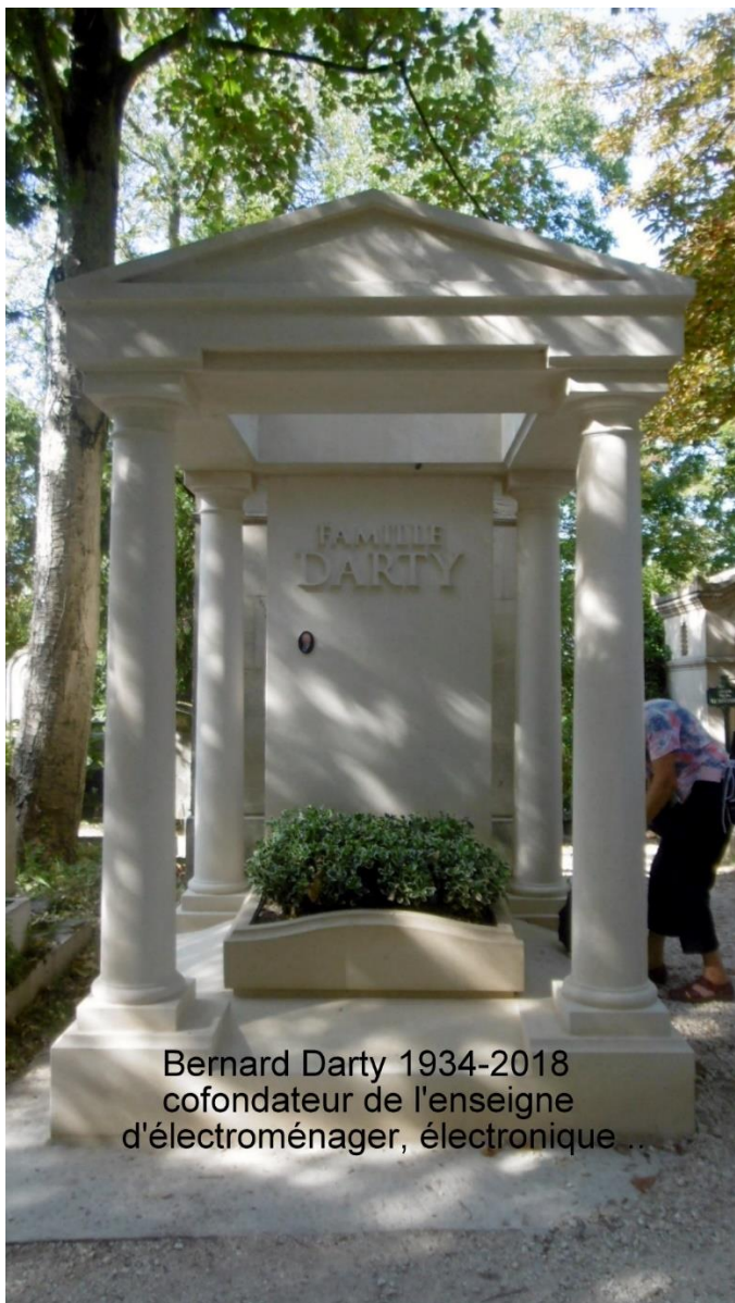
Bernard Darty 1934-2018 cofondateur de l'enseigne d'électroménager, électronique...