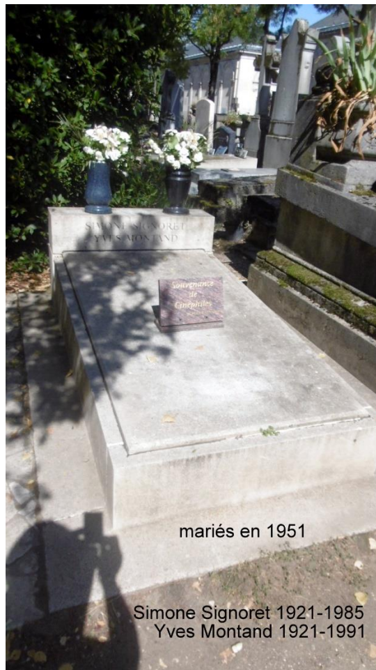
mariés en 1951