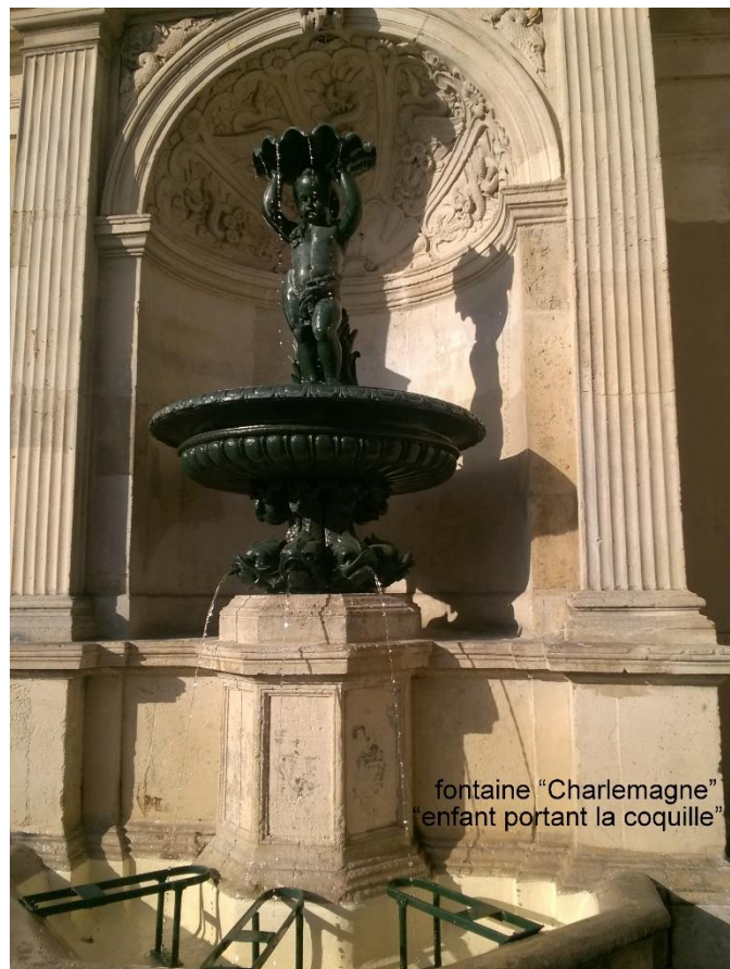
fontaine "Charlemagne" "enfant portant la coquille"