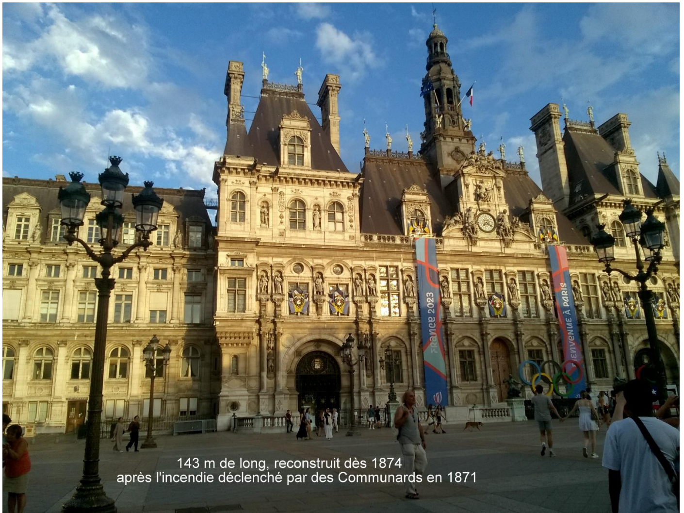
143 m de long, reconstruit dès 1874 après l'incendie déclenché par des Communards en 1871