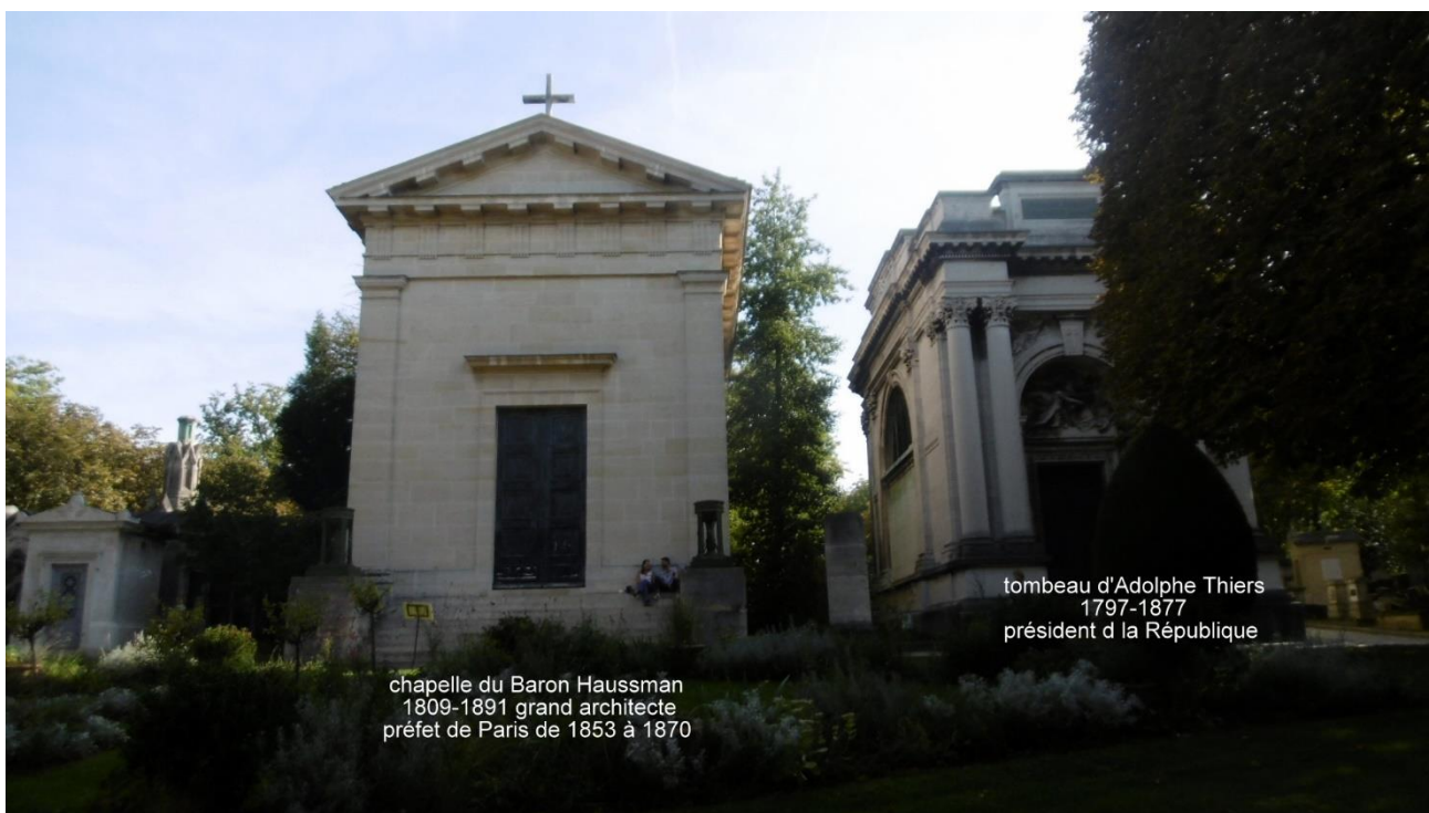
chapelle du Baron Haussman 1809-1891 grand architecte préfet de Paris de 1853 à 1870